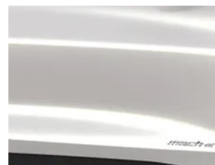
Bílá Star unikátní metalická