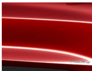
Červená Lucid unikátní metalická