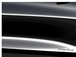
Šedá Carbonized unikátní metalická