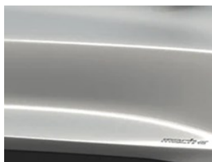
Bílá Space metalická